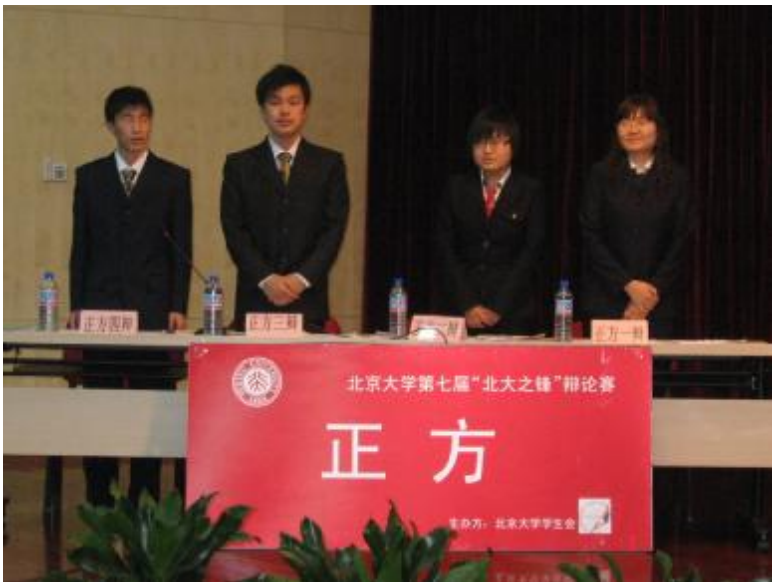
医学部代表队是本届北大之锋最“灰色”的队伍