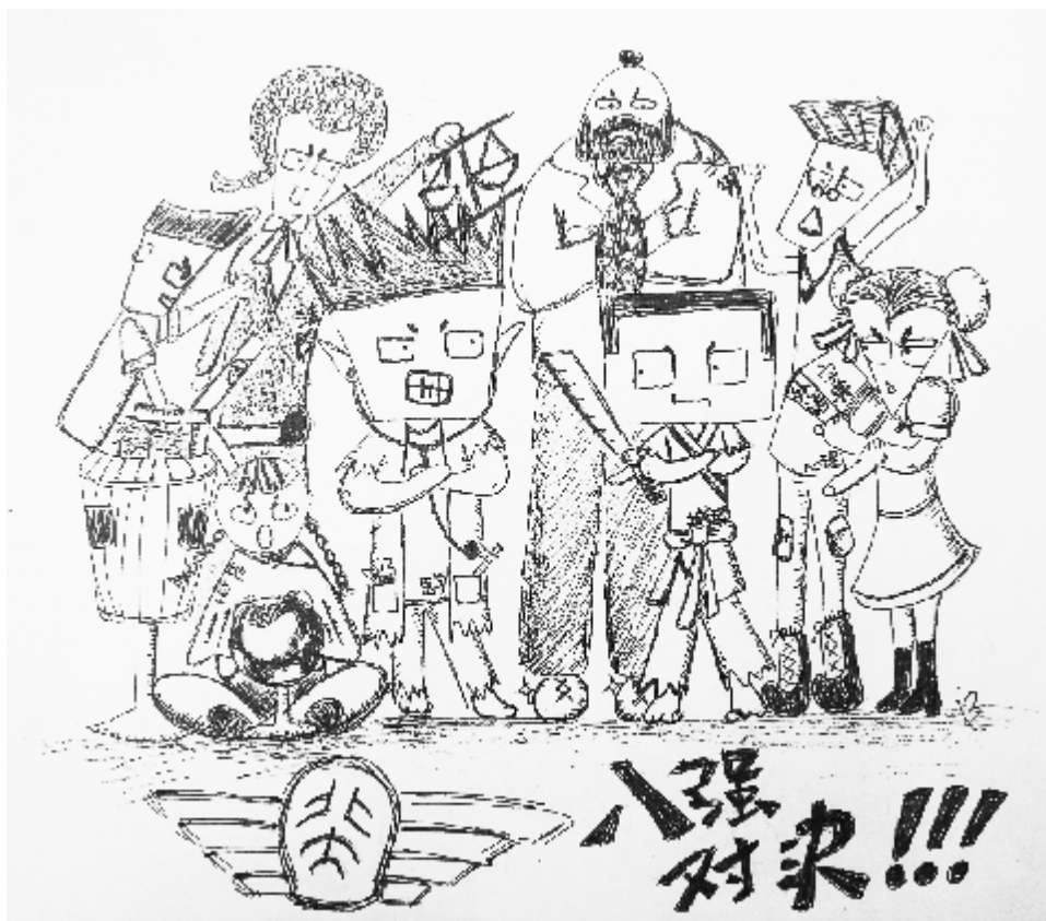
漫画 / 罗丽蓉